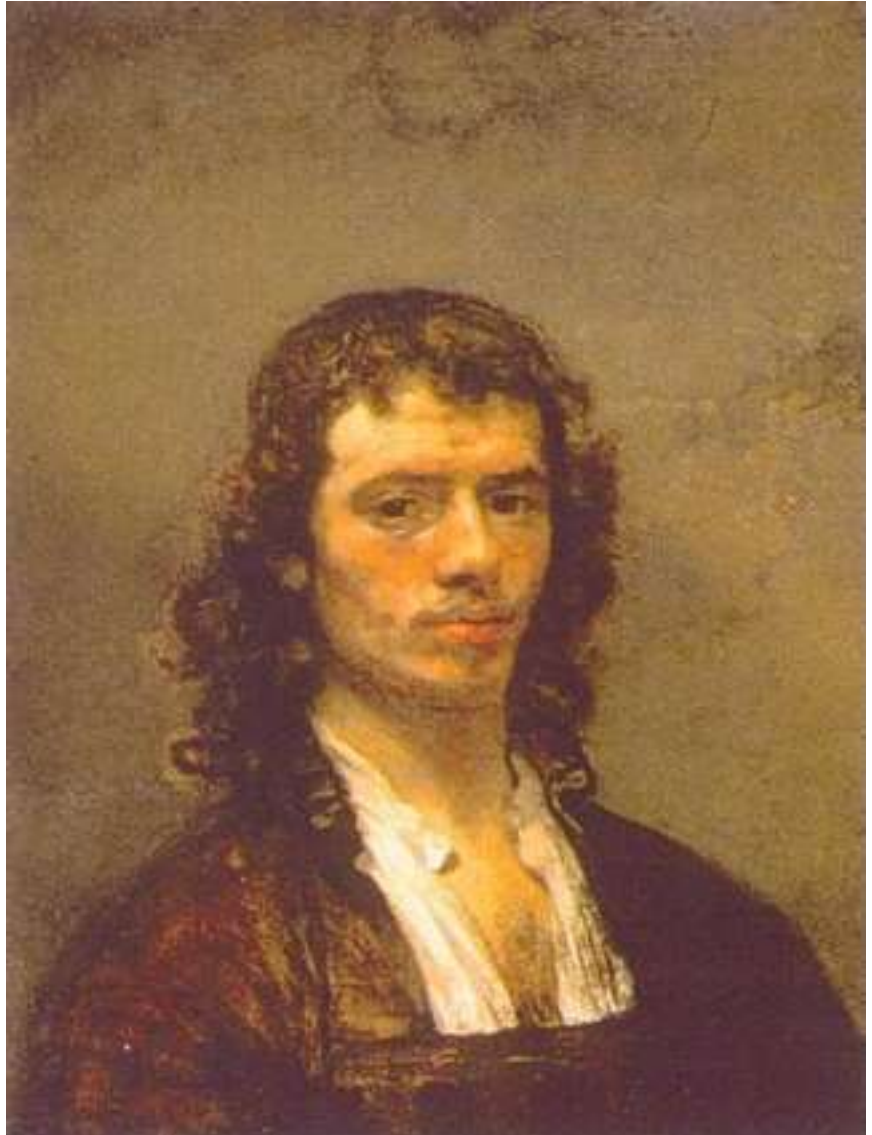
Carel Fabritius, Zelfportret, ca. 1645-1650 Paneel, 65 x 49 cm, Museum Boijmans Van Beuningen, Rotterdam