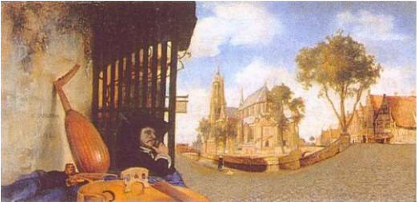
Carel Fabritius, Gezicht in Delft, ca. 1652 Doek, 15,4 x 31,6 cm, The National Gallery, Londen

naar een geheel nieuwe en originele lichtbehandeling. In dit zonnovergoten tafereel, met een rustende soldaat en zijn hond heeft hij een bijna absolute verstilling bereikt.