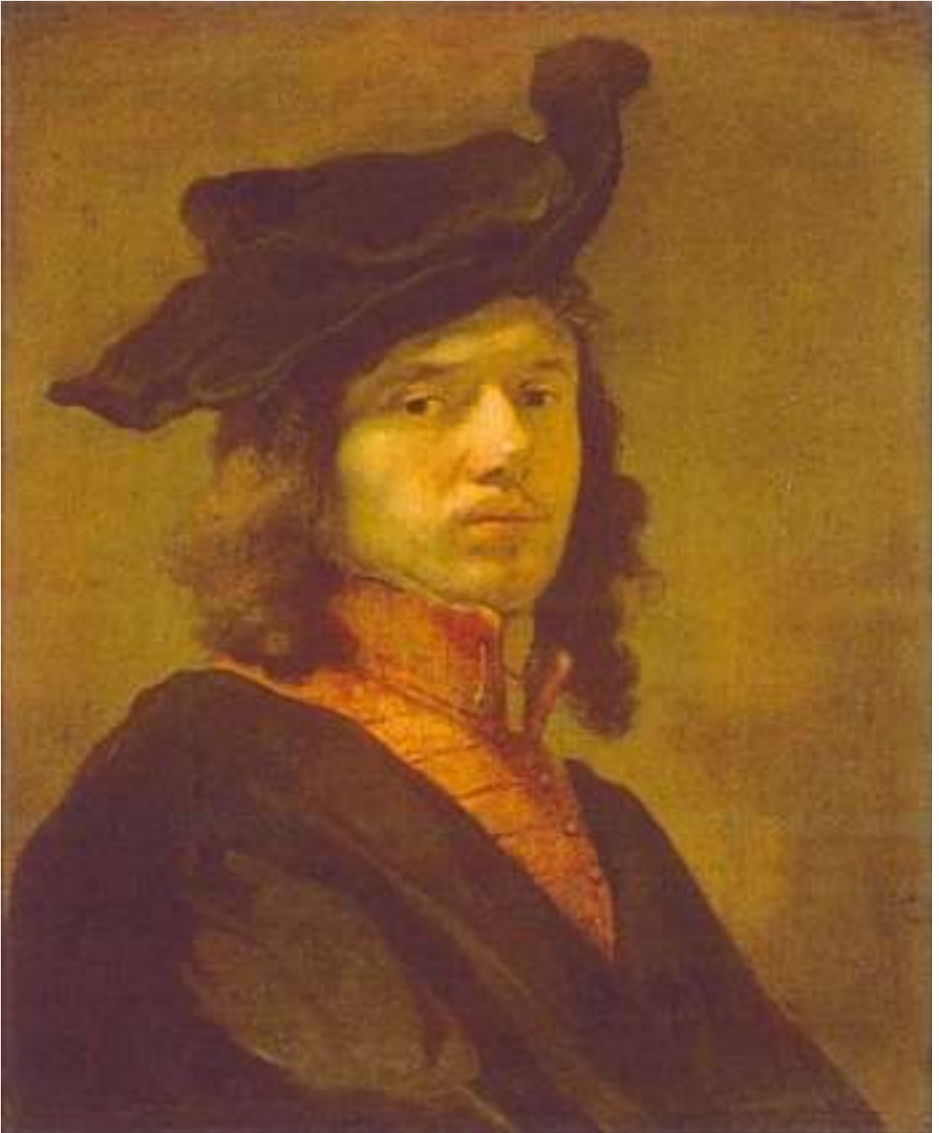
Carel Fabritius, Portret van een jonge man, ca. 1645 Doek, 62,5 x 51 cm, Bayerische Staatsgemäldesammlungen, Alte Pinakothek, München