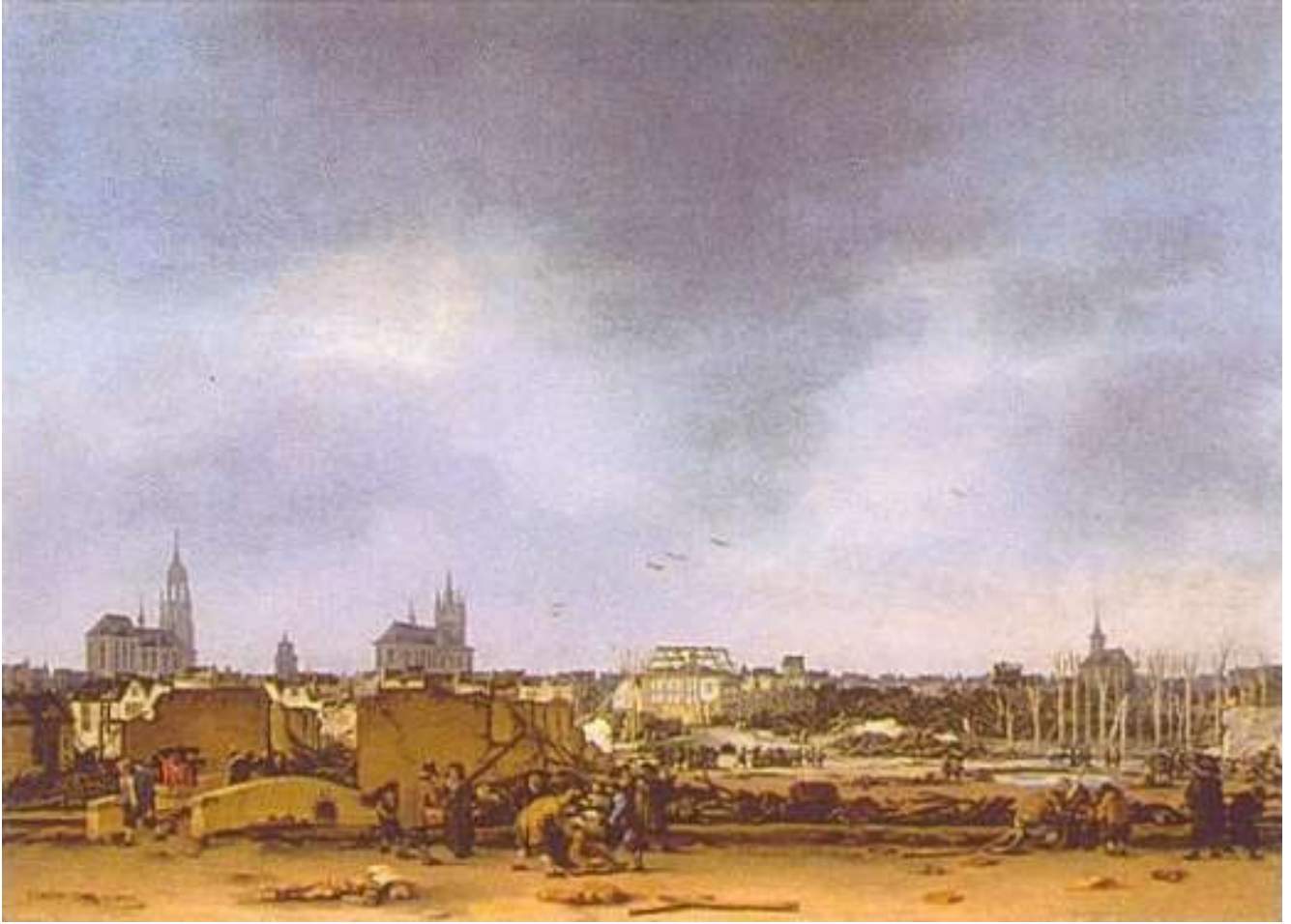
Egbert van der Poel, Gezicht op Delft na de explosie, ca. 1654 Panel, 36,2 x 49,5 cm, The National Gallery, Londen