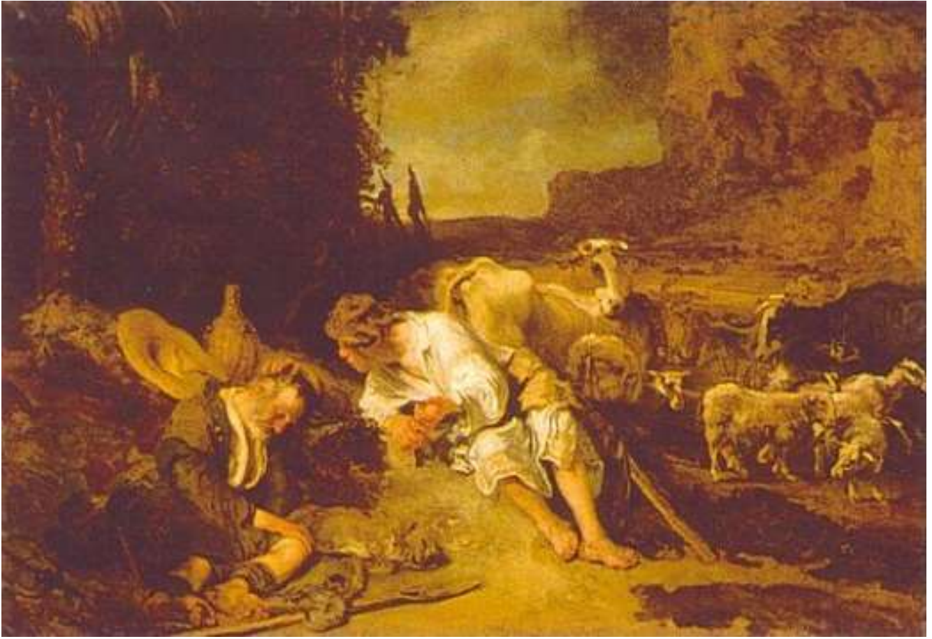
Carel Fabritius, Mercurius en Argus, ca. 1645-1647

Doek, 73,5 x 104 cm, Los Angeles County Museum of Art, Los Angeles [gift of The Ahmanson Foundation]