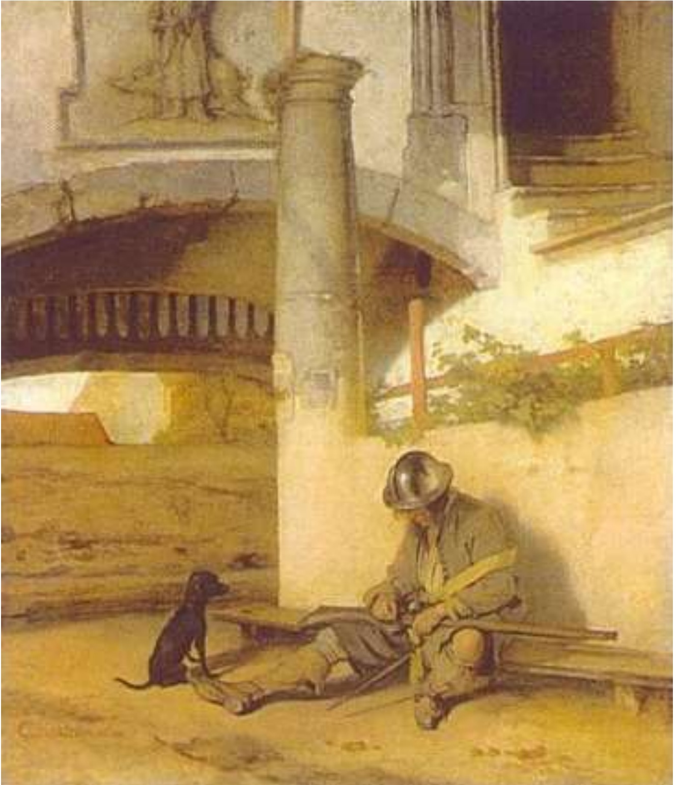
Carel Fabritius, De schildwacht, ca. 1654 Doek, 68 x 58 cm, Staatliches Museum, Schwerin