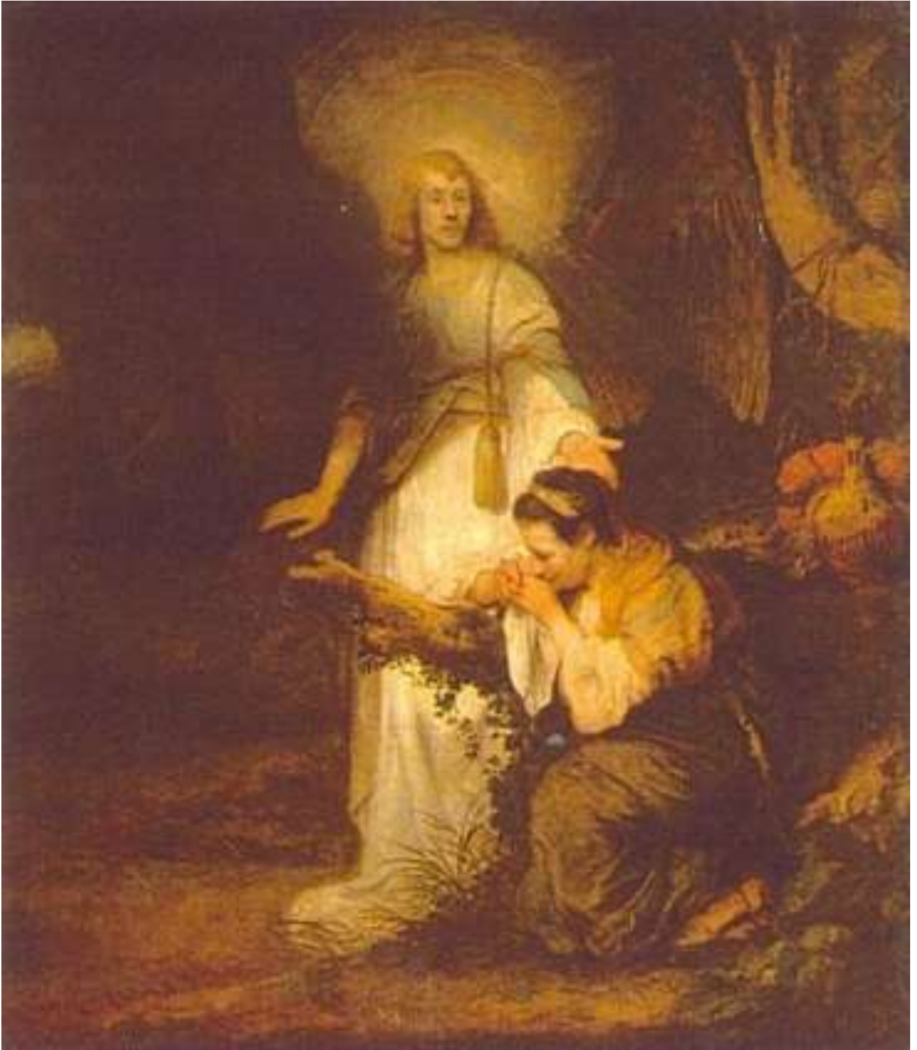
Carel Fabritius, Hagar en de engel

Doek, 157,5 x 136 cm, Residenzgalerie, Collectie Schönborn-Buchheim, Salzburg