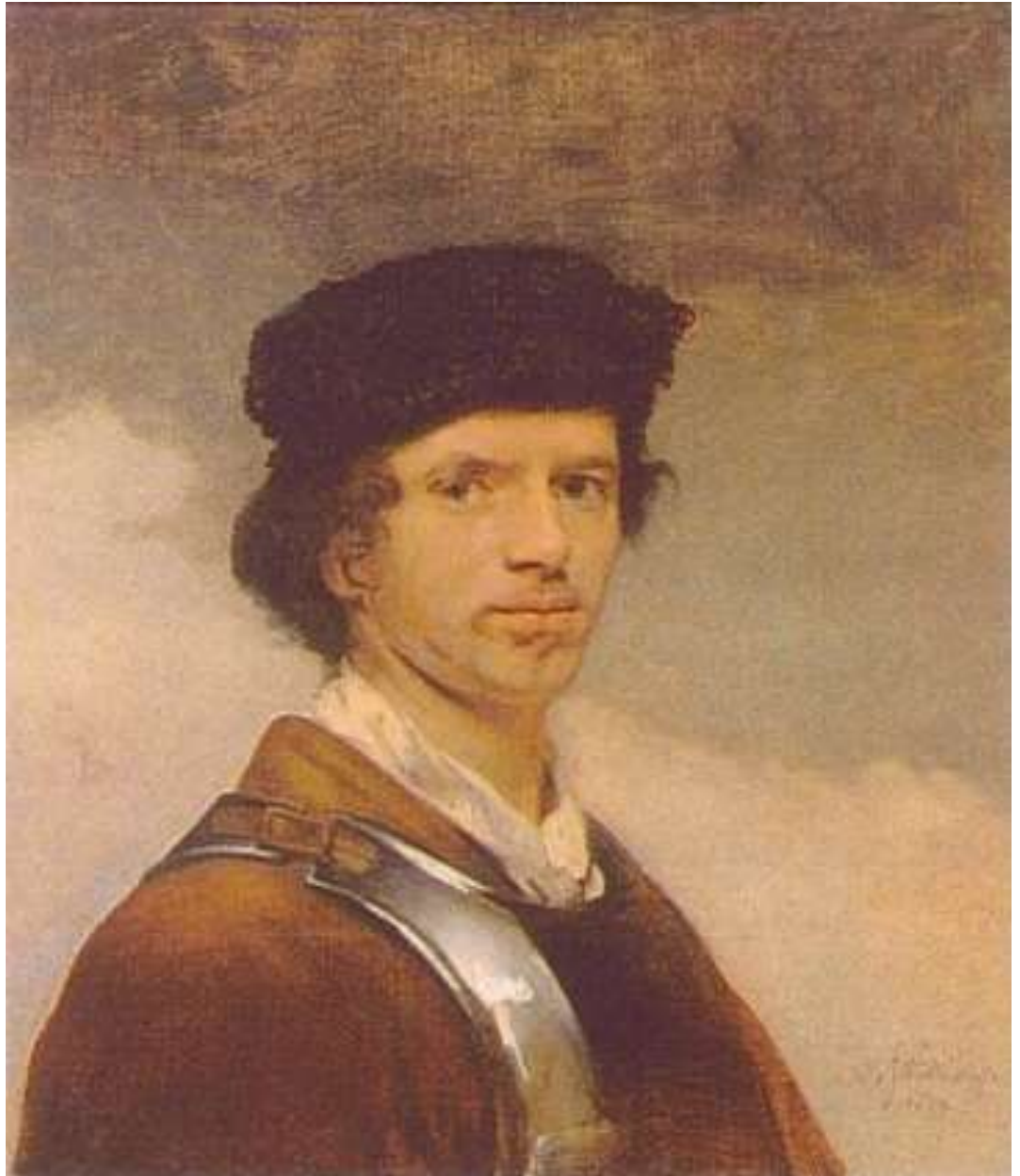
Carel Fabritius, Zelfportret, ca. 1654 Doek (Canvas), 70,5 x 61,5 cm, The National Gallery, Londen