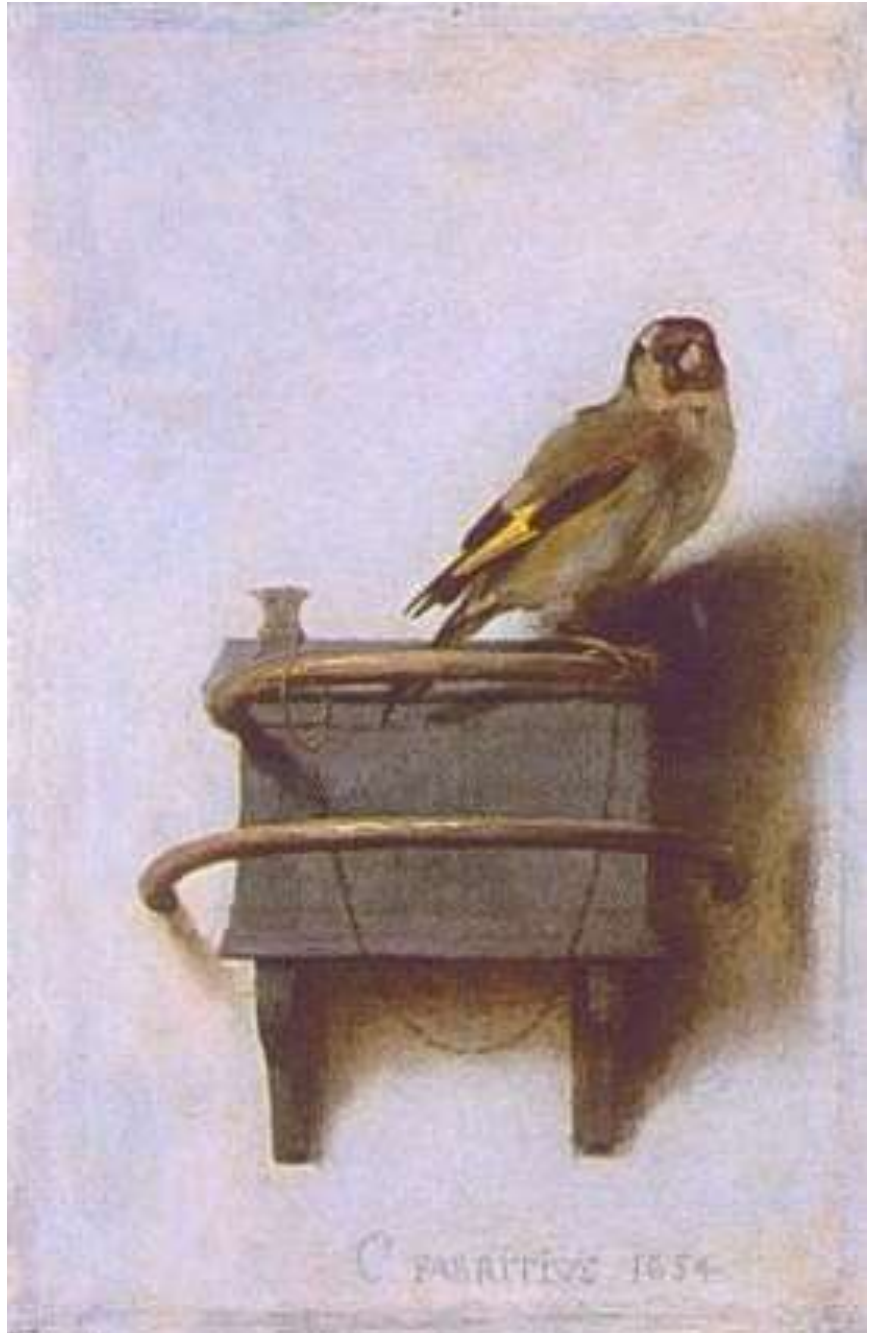
Carel Fabritius, Het puttertje, ca. 1654 Paneel, 33,5 x 22,8 cm, Mauritshuis, Den Haag

Fabritius' Gezicht in Delft, De schildwacht en Het puttertje, alle drie uit zijn Delftse periode, behoren tot de onbetwiste topstukken van de Hollandse schilderkunst. Het Gezicht in Delft is geschilderd als achterwand van een zogenaamde perspectiefkast: de voorstelling moest bekeken worden door een kleine opening in de voorzijde. Dergelijke constructies waren destijds vooral in Delft bijzonder populair en bronnen bevestigen dat ook Fabritius zulke kijkkasten gemaakt heeft. Op het platte vlak is het perspectief van de