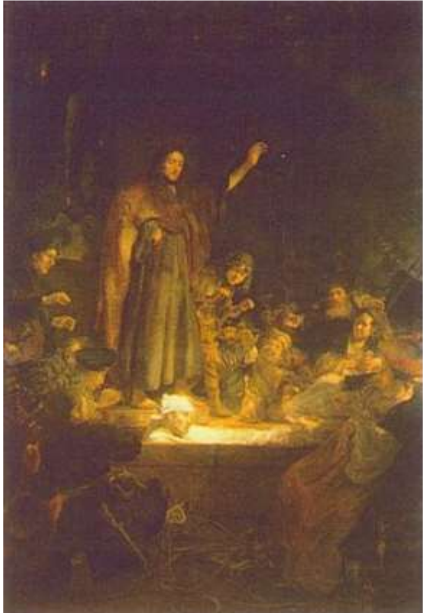
Carel Fabritius, De opwekking van Lazarus, ca. 1645 Doek, 210,5 x 140 cm, Nationaal Museum, Warschau

Ter voorbereiding op de tentoonstelling is Het puttertje, een van de publiekslievelingen uit de collectie van het Mauritshuis, in het voorjaar van 2003 gerestaureerd. Tijdens de openbare restauratie is de vergeelde vernislaag verwijderd zodat de oor-